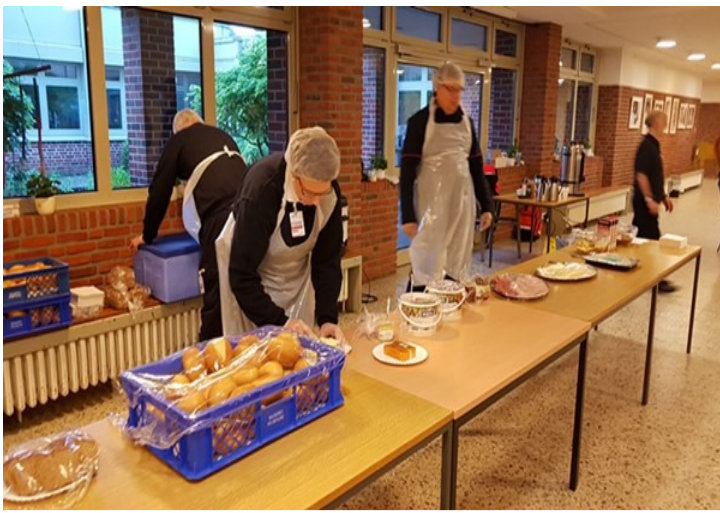
Frühstücksausgabe in der Regenbogenschule