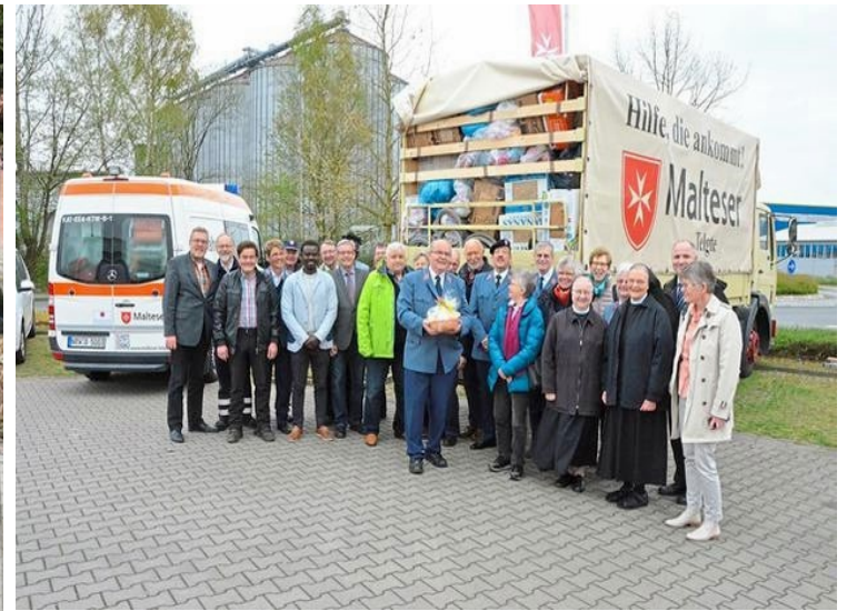
Verabschiedung 170. Hilfstransport nach Schlesien