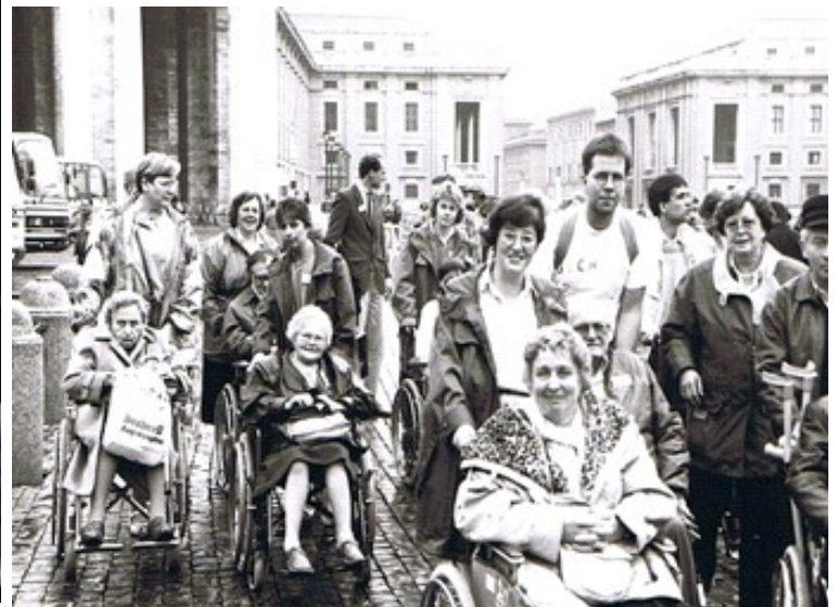
Erste Behinderten Romwallfahrt 1991