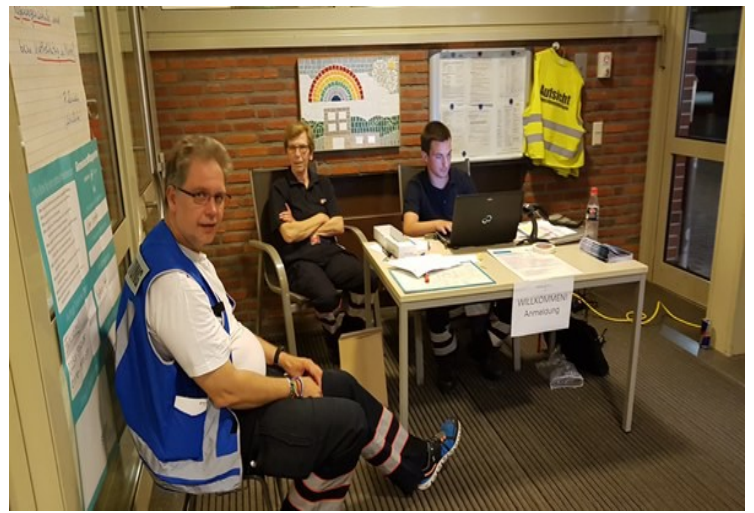
Ein- Ausgangsregistrierung der Katolikentagsgäste