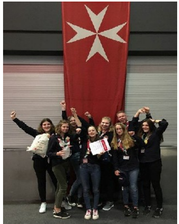
Malteser Jugend belegt den 4. Platz beim Bundeswettbewerb in Landshut.