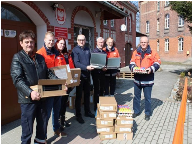
Laptops für eine Schule in Glatz