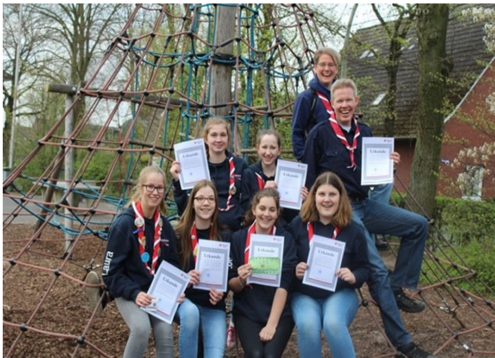
Malteser Jugend belegt beim Diözesanwettbewerb 2017 in Metelen den 1. Platz und sicherte sich das Ticket zum Bundeswettbewerb nach Landshut