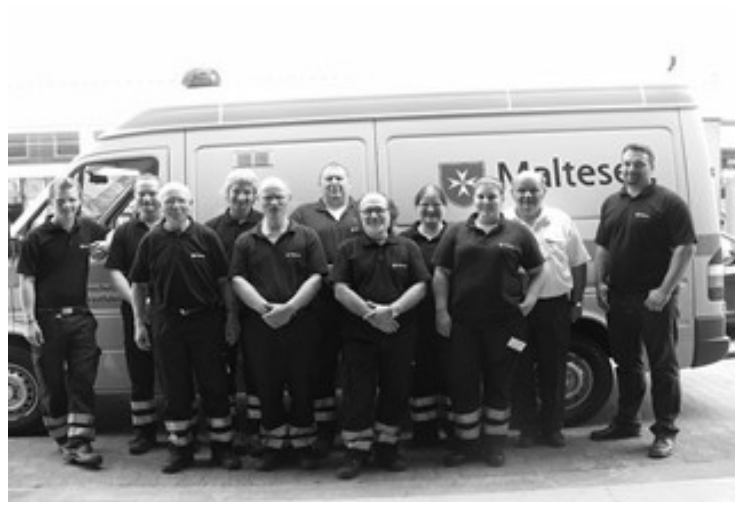
Sieben Malteser aus Telgte bestanden ihre Prüfung zum Einsatzsanitäter